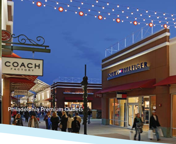
Philadelphia Premium Outlets