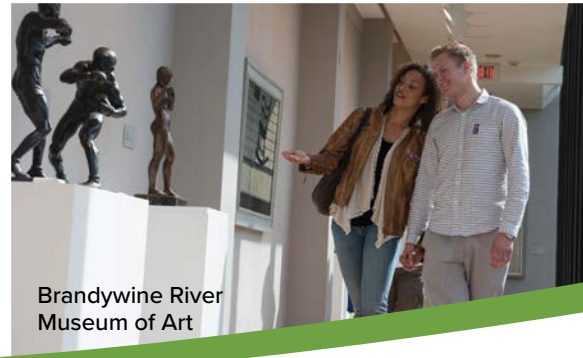
Brandywine River Museum of Art

Etwas außerhalb des Stadtgewimmels, hinter der Flussbiegung und in der grünen Hügellandschaft liegt die Countryside of Philadelphia.