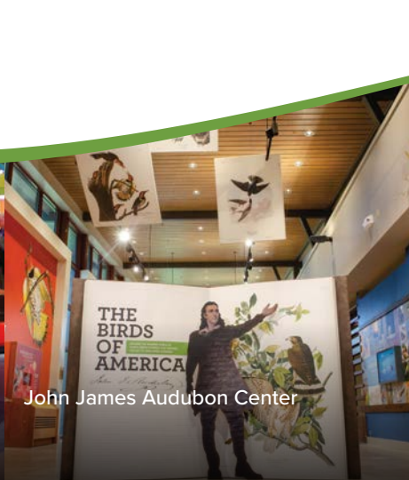
John James Audubon Center