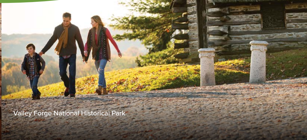
Valley Forge National Historical Park