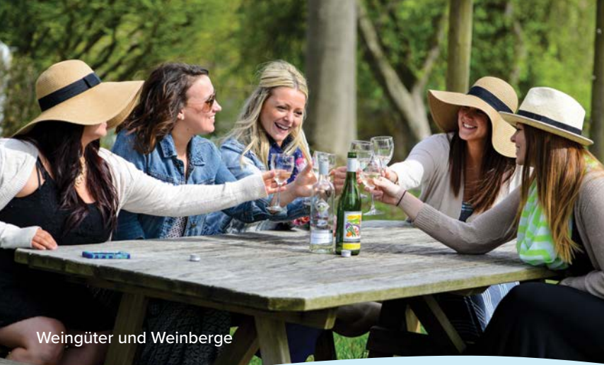
Weingüter und Weinberge