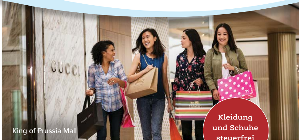
King of Prussia Mall

Kleidung und Schuhe steuerfrei einkaufen!