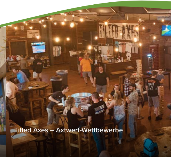
Titled Axes – Axtwerf-Wettbewerbe