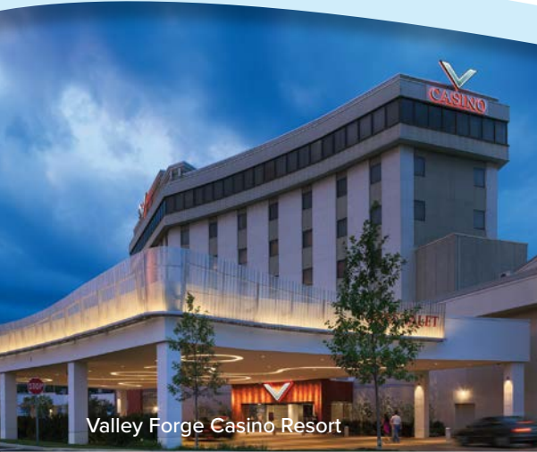
Valley Forge Casino Resort