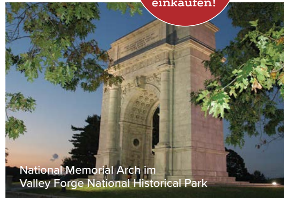
National Memorial Arch im Valley Forge National Historical Park